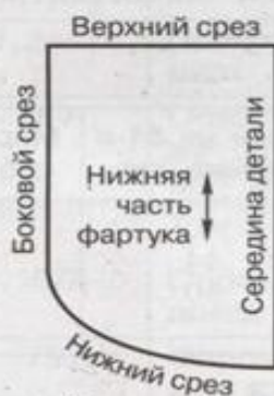
Рис. 29. Названия деталей и срезов выкройки нижней части фартука на поясе